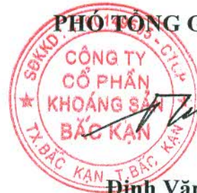
Đình Văn Hiến